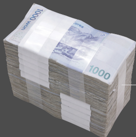
필름 밴드 대속