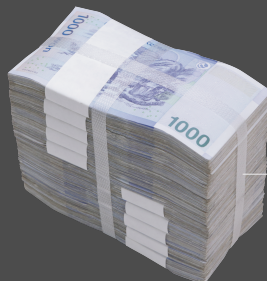
pp 밴드 대속

www.bindtec.kr TEL : 031 734 2868 FAX : 031 734 2869 E-MAIL : bindtec@naver.com 경기도 성남시 중원구 사기막골로 177, 1011호